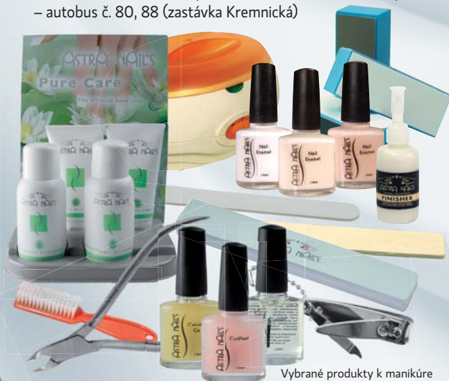
Vybrané produkty k manikúre